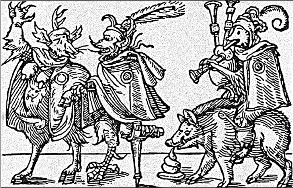
Фото 3.1. Євреї, які віддають шану Сатані. Гравюра з книги П'єра Буасто «Цікаві історії» (Париж, 1575).

© Трахтенберг Дж. Дьявол и евреи. Средневековые представления о евреях и их связь с современным антисемитизмом. – М.: Гешарим, 1998