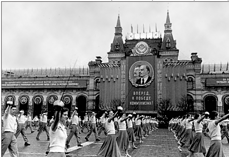
Фото 9.5. Спортивний парад на Червоній Площі, Москва.