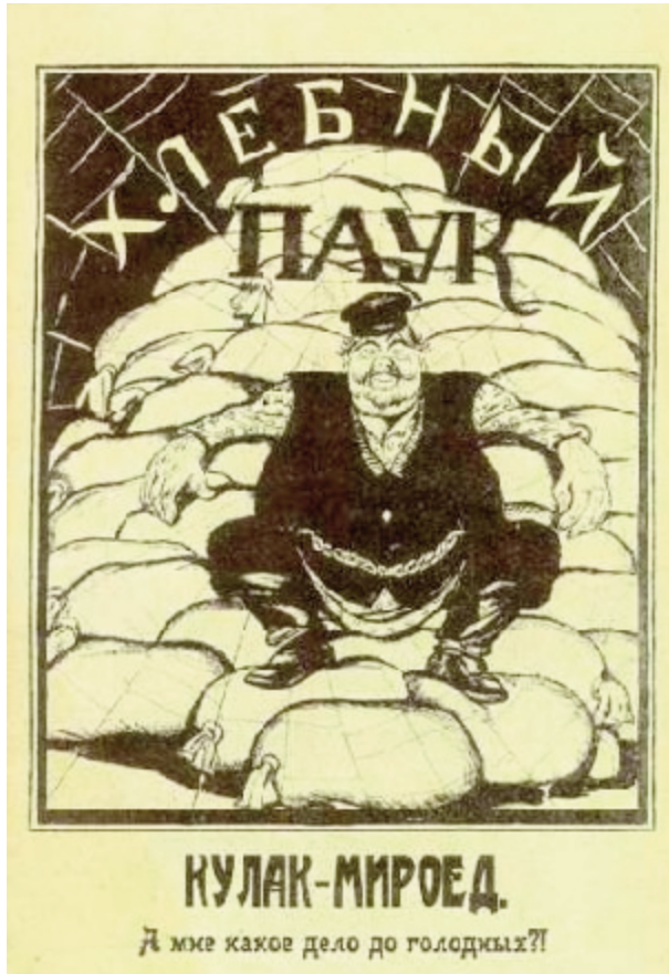
Ілюстрація 1. Радянський плакат. Підпис: «Хлібний павук. Кулак-мироїд. А мені яка справа до голодних?!».