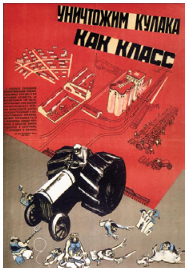
Ілюстрація 2. Радянський плакат. Підпис: «Знищимо кулака як клас».