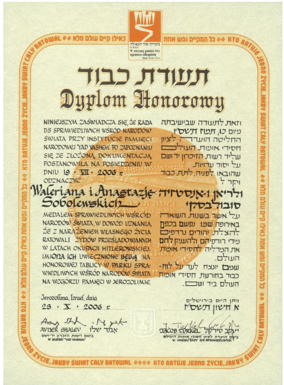
Medal i dyplom Yad Vashem przyznawany Sprawiedliwym wśród Narodów Świata za bezinteresowne ratowanie Żydów w czasie okupacji hitlerowskiej.